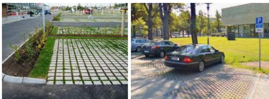
Figur 7: Exempel på genomsläppliga parkeringsytor.

Genomsläpplig beläggning bidrar med fördröjning samt rening av dagvattnet på parkeringsytorna. Reningseffekten uppstår när dagvattnet infiltrerar genom ytbeläggningen och i underliggande marklager. Anläggningen kan även bidra till att oljespill och andra organiska föroreningar avskiljs och bryts ner. Nedan visas några exempel på genomsläppliga parkeringar, se Figur 7.