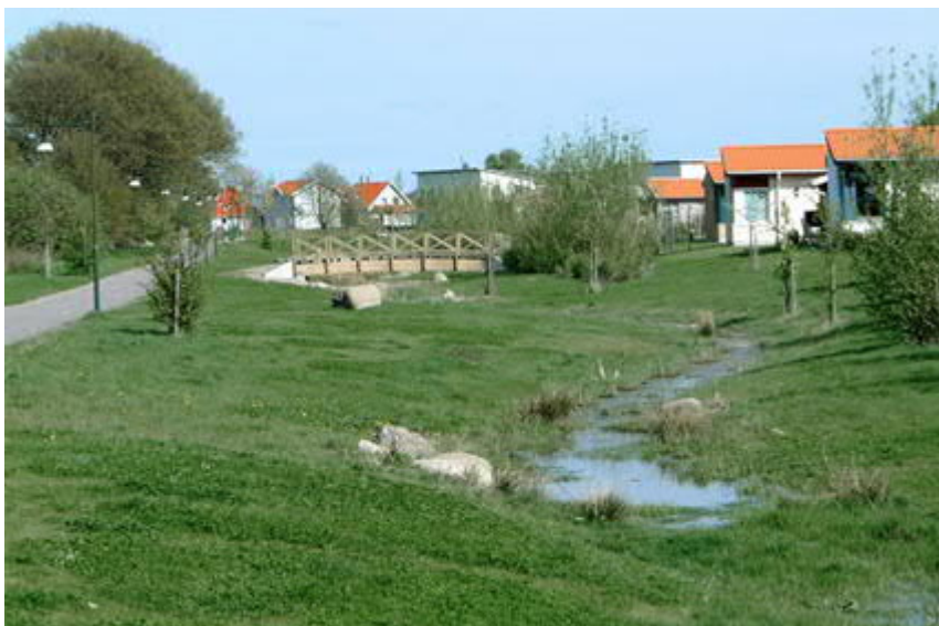
Figur 5: Exempel på svackdiken.

rekommenderade svackdikena och diken innan vattnet släpps vidare. Se exempel på svackdike i Fel! Hittar inte referensälla..