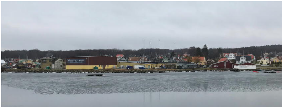
Figur 2: Nuvarande situationsläge.

Området är cirka 1,5 ha stort. Exploatering av planområdet medger byggnation av mindre flerbostadshus, se Figur 3. Andelen hårdgjorda ytor minskar (i jämförelse med dagens situation) i samband med exploateringen därmed ökar gröna ytor i motsvarande andel. Detta medför att flöden minskar inom planområdet efter exploatering.