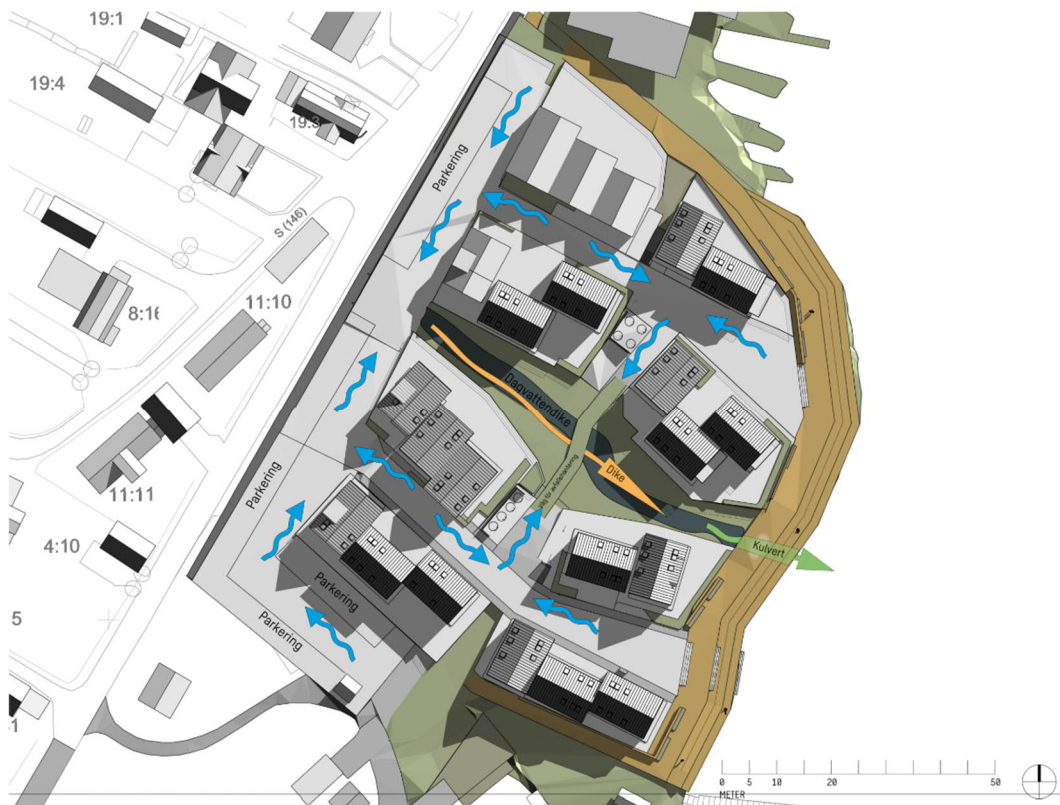
Figur 4: Rekommenderade lutningar för hantering och avledning av dagvattnet inom planområdet. Flödesriktningar har markerats med blå pilar. Dikena är markerade med orangea pilar, grönt visar placering av kulvert för utlopp i havet.