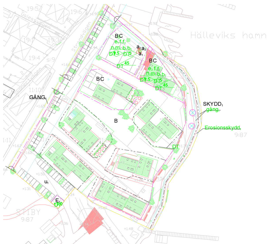
Figur 3: Illustrationskarta.

Området är cirka 1,5 ha stort. Exploatering av planområdet medger byggnation av mindre flerbostadshus, se Figur 3. Andelen hårdgjorda ytor minskar (i jämförelse med dagens situation) i samband med exploateringen därmed ökar gröna ytor i motsvarande andel. Detta medför att flöden minskar inom planområdet efter exploatering.