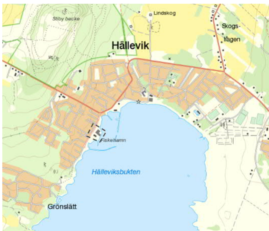
Figur 1: Översiktskarta.

Denna dagvattenutredning tas fram för att utifrån områdets naturliga förutsättningar, såsom topografi och jordarter. Föreslag har tagits fram för en hållbar dagvattenhantering enligt den markanvändning som detaljplanen medger, se Figur 1.